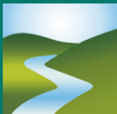
Unione Comuni Valli Reno Lavino Samoggia