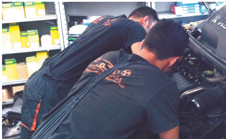
Tirocinante e tutor aziendale

ASC InSieme, nell'ambito degli interventi sociali finalizzati al mantenimento, acquisizione e recupero dell'autonomia delle persone in carico, ha attivato un progetto di orientamento lavorativo adulti che, attraverso équipe educative specializzate, monitora gli inserimenti in Azienda e sostiene il percorso professionalizzante dei/delle tirocinanti attraverso interventi individualizzati. Il tirocinio inclusivo, infatti, può essere modulato in relazione alle diverse caratteristiche delle persone e può rispondere a bisogni che vanno dal mantenimento delle competenze (in contesti con caratteristiche di protezione) al sostegno all'inserimento lavorativo (in contesti produttivi).