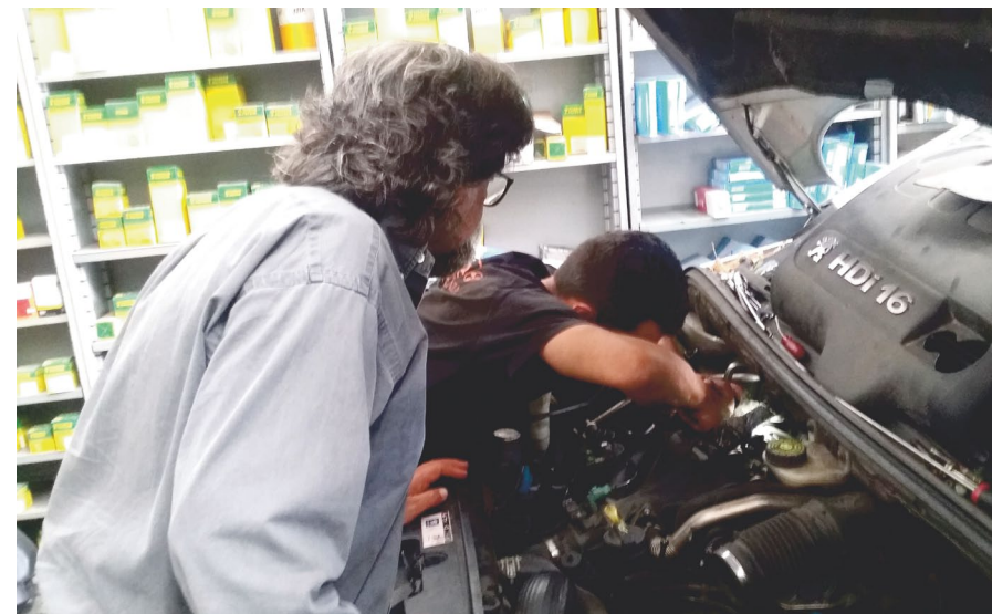
Educatore e tirocinante in Azienda