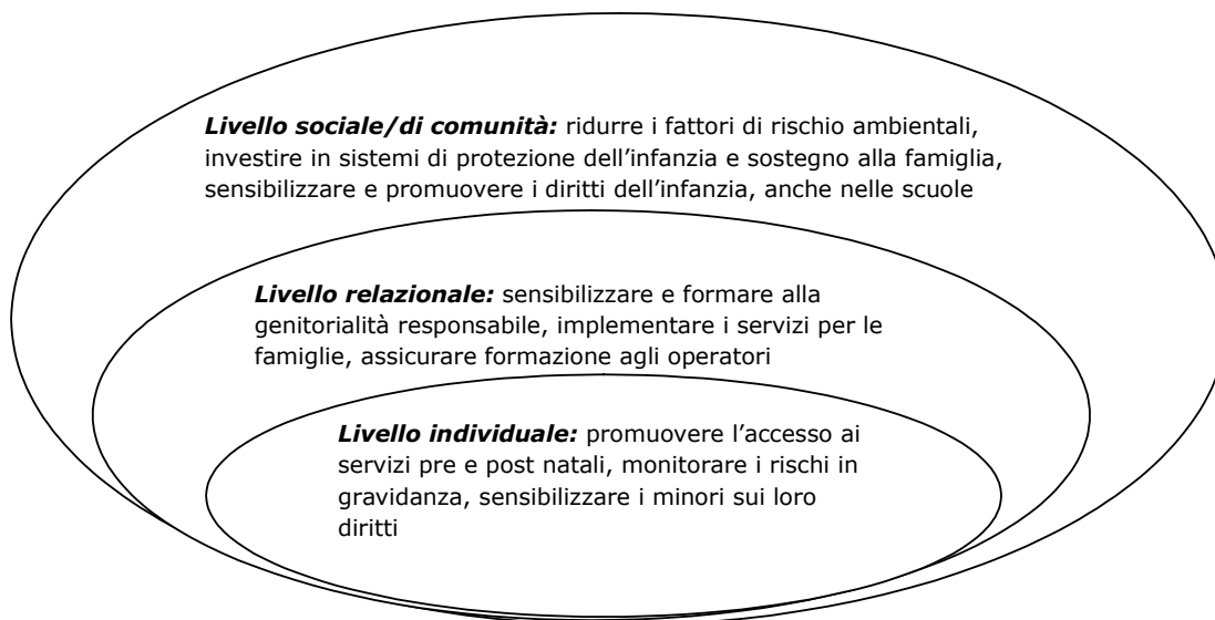
Figura 2. Prospettiva ecologica: strategie preventive.